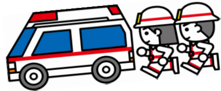
傷病者の搬送体験

人の命を救うには 体力、技術、気持ち 全てが必要です！ しっかりみんなで訓練 しようね！